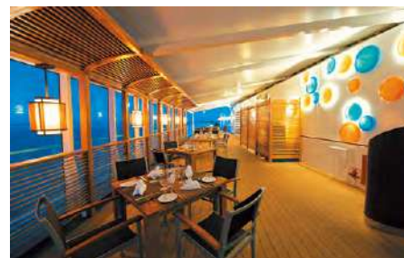
ル・グリル [朝食] [昼食] [夕食・要予約]

ディナーのためだけにオープンするこの優雅なメインダイニング「レトワール」では、美しく施された内装、そして魅惑的なスペシャリテをもって五感を満たします。メニューは日替わりで、無料のワインとのペアリングもお楽しみください。※予約不要のオープンシーティングのレストランです。