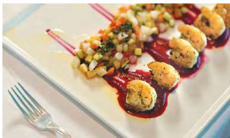
ラ・ベランダ [朝食] [昼食] [夕食・要予約]

オーシャンビューのお席や屋外デッキでのお食事を楽しめる「ラ・ベランダ」では、寄港地にインスピレーションを受けたアラカルトや、趣向を凝らしたビュッフェ(朝食・昼食)をご提供しております。ディナーは、パリの有名シェフ ジャン・ピエール・ヴィガト監修のグルメキュイジーヌをご堪能いただけるスペシャルティ・レストラン(予約制)となります。