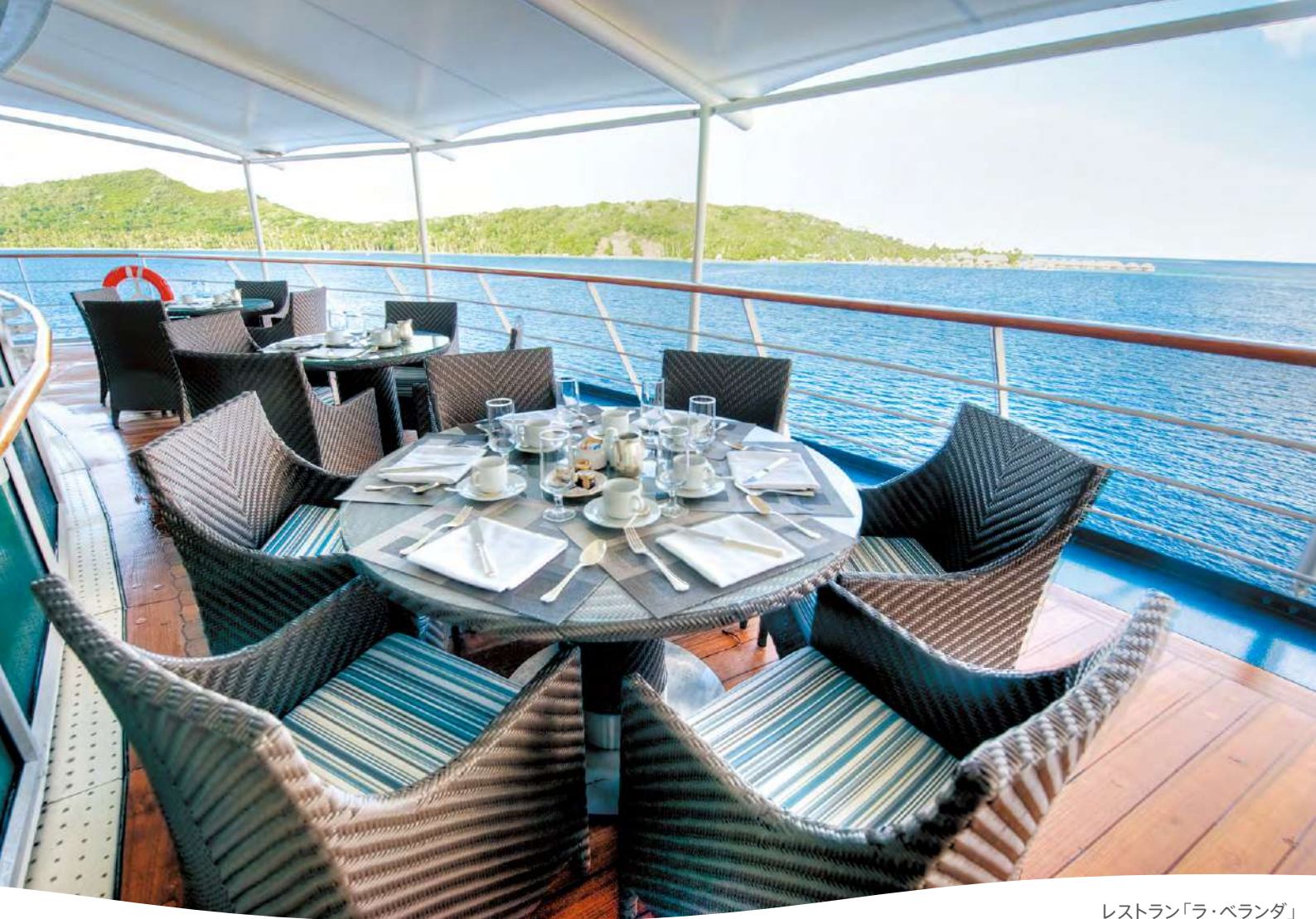
レストラン「ラ・ベランダ」