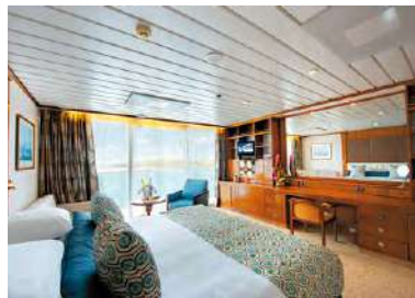
A ベランダ・スイート

客室は全室オーシャンビュー、ほとんどの客室がバスタブ付きでバスローブやスリッパ、アルゴテルムのアメニティも備えています。カテゴリ B 以上にはバトラーサービスが付きまます。